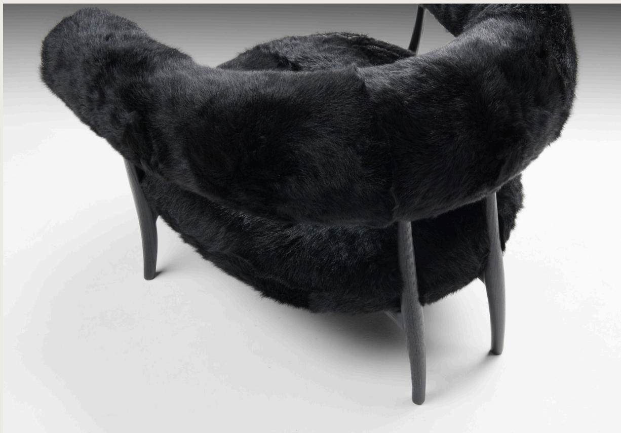
ARTEMISIA Poltrona / Armchair Natural Black Goatskin, Black Ash Wood